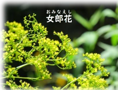
おみなえし 女郎花