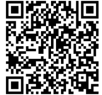
申込み QR コード