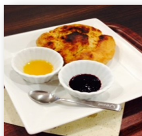
スコーン (蜂蜜&苺ジャム) 246円(270円)