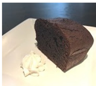
フェアトレードチョコ使用 濃厚チョコレートパウンドケーキ 373円(410円)