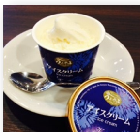
うぶやま アイスクリーム 305円(335円)