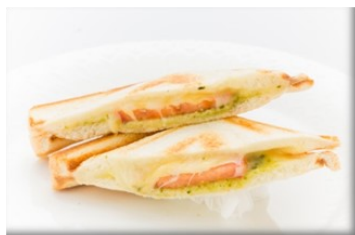
阿蘇バジルトマト&チーズ