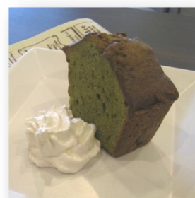
熊本県産 抹茶パウンドケーキ 336円(370円)