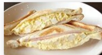
ハム&たまごサラダ